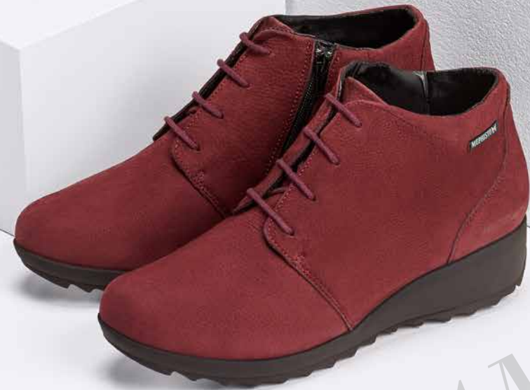
ATHINA° 2 1/2 - 8 1/2 180,- €