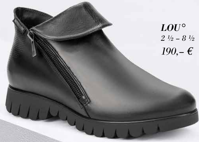
LOU° 2 1/2 - 8 1/2 190,- €