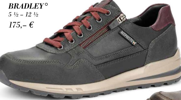
BRADLEY° 5 1/2 - 12 1/2 175,- €