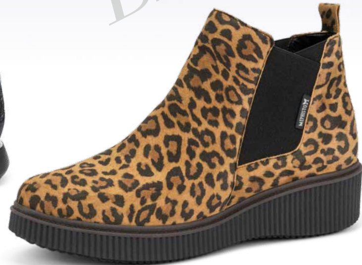
EMIE° 2 1/2 - 8 1/2 180,- €

TITEL: Damenmodell: AGATHA° (2 1/2 - 8 1/2) 185,- €; Herrenmodell: PITT° (6 - 12 1/2) 215,- €