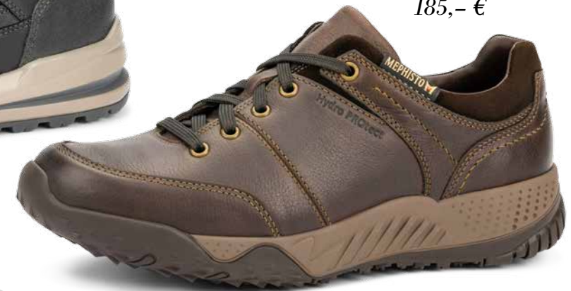
FABIANO° 5 1/2 - 12 1/2 185,- €