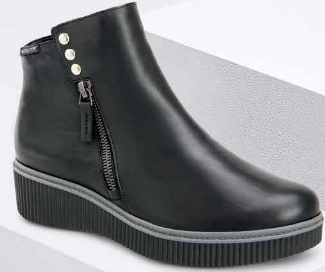
EWA° 2 1/2 - 8 1/2 199,90 €