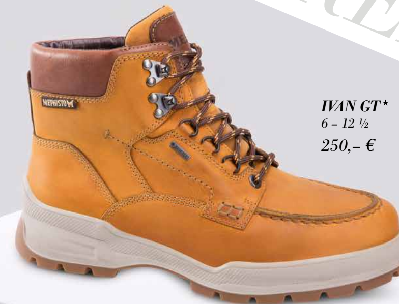
IVAN GT* 6 - 12 1/2 250,- €

HYDRO Protect schützt vor Feuchtigkeit und macht das Oberleder wasserabweisend.